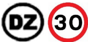
Αρχή ζώνη ελέγχου Ταχύτητας (Όριο 30 χλμ/ω)

15.2.1 Ο οργανωτής μπορεί να ορίσει στις απλές ή στις δοκιμασίες ακριβείας σημεία / ζώνες ελέγχου ταχύτητας μέσα στα οποία θα γίνεται έλεγχος από το δορυφορικό σύστημα ασφαλείας/χρονομέτρησης. Η εκκίνηση και το τέλος της ζώνης ελέγχου ταχύτητας θα απεικονίζονται στο road book με τα παρακάτω σήματα και παράλληλα η έναρξη ζώνης θα περιέχει και την μέγιστη επιτρεπτή ταχύτητα στην συγκεκριμένη ζώνη. Μετά το τέλος της ζώνης ελέγχου ταχύτητας η ΜΩΤ θα επιστρέφει αυτόματα στην προηγούμενη πριν την έναρξη της ζώνης ελέγχου ή σε νέα που θα δώσει ο οργανωτής.