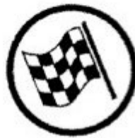
End of regularity test