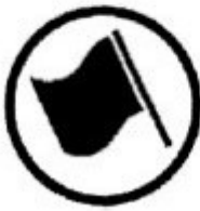
Regularity test start